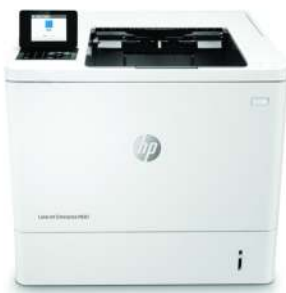
HP LaserJet Enterprise M607n

Dieser HP LaserJet Drucker mit JetIntelligence kombiniert herausragende Leistung und Energieeffizienz mit Dokumenten in professioneller Qualität zum richtigen Zeitpunkt – Ihr Netzwerk bleibt dabei durch die branchenweit umfassendsten Sicherheitsfunktionen geschützt 1