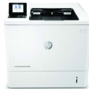
HP LaserJet Enterprise M607dn

Dynamic-Security-fähiger Drucker. Ausschließlich für die Verwendung mit Patronen mit Original HP Chip vorgesehen. Patronen mit Chips anderer Hersteller funktionieren möglicherweise nicht oder in Zukunft nicht mehr. Weitere Informationen unter: