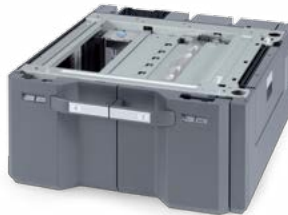
3.000-BLATT-PAPIERKASSETTE PF-740 Unterstützt die Formate A4, B5.