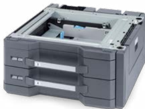
1.000-BLATT-PAPIERKASSETTE PF-730(B) Ideal für Papierformate von A5R bis A3, 305 mm x 457 mm.