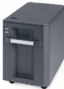
3.000-BLATT-PAPIERMAGAZIN PF-770 Ideal für hochvolumige Jobs in A4.