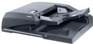
AUTOMATISCHER ORIGINALEINZUG MIT DUPLEX-SCAN DP-772 Scannt doppelseitige Dokumente in einem Arbeitsgang.

Wählen Sie aus einem umfassenden Angebot an Optionen. Zwei Originaleinzüge und zwei Finisher – einer mit einer optionalen Broschüren-Einheit – können Ihrem Basissystem hinzugefügt werden. Mit zusätzlichen Papierkassetten erreichen Sie eine Kapazität von bis zu 7.650 Blatt für unterbrechungsfreies Drucken auf acht verschiedenen Papierformaten.