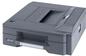
500-BLATT-MULTIMEDIA-KASSETTE PF-780 Papiermagazin für spezielle Medienarten. Für die Kombination mit PF-730 und PF-740.