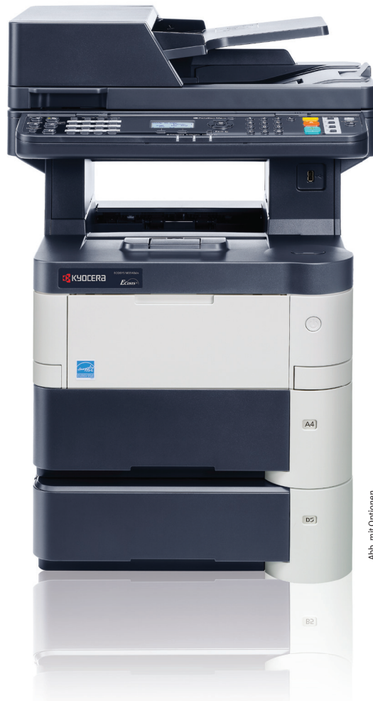
Abb. mit Optionen