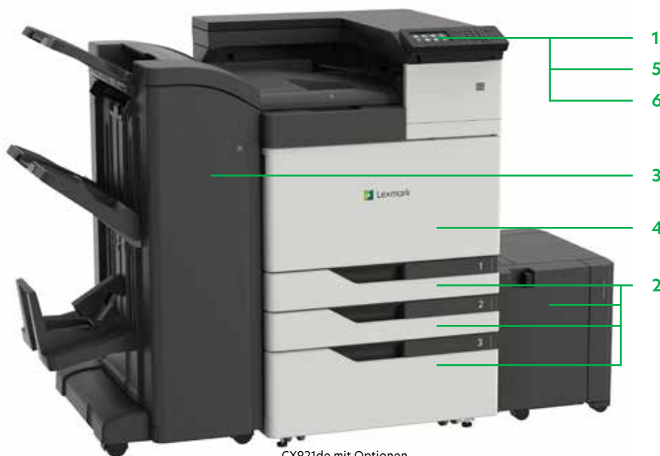
CX921de mit Optionen

Drucken Sie Microsoft Office-Dateien, PDFs und andere Dokument- und Bildarten von Flash-Laufwerken, oder wählen Sie Dokumente auf Netzwerk-Servern oder Online-Laufwerken aus und drucken Sie sie.