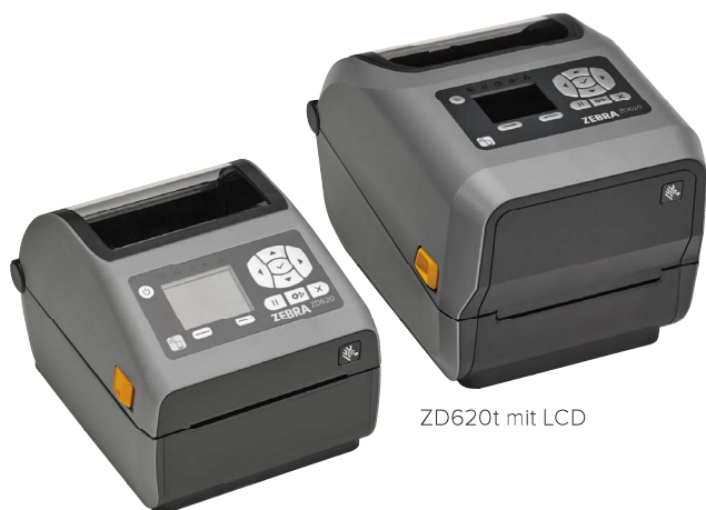
ZD620d mit LCD

Wenn Druckqualität, Produktivität, Anwendungsflexibilität und einfache Verwaltung eine hohe Priorität haben, ist der Zebra ZD620 die erste Wahl. Der ZD620, der die neue Generation der Desktopdrucker-Reihe von Zebra darstellt, löst die beliebte GX-Serie und den ZD500 ab. Mit seiner überragenden Druckqualität und hochmodernen Features bietet er weitaus mehr als herkömmliche Desktopdrucker. Der als Thermodirekt- und Thermotransfer-Modell sowie als Spezialmodell für das Gesundheitswesen erhältliche ZD620 erfüllt eine Vielzahl von Anwendungsanforderungen. Er bietet mehr Standardfunktionen als jeder andere Zebra-Desktopdrucker sowie ein optionales Bedienfeld mit zehn Tasten und LCD-Farbdisplay, das Druckereinstellung und Statusprüfung zum Kinderspiel macht. Der ZD620 nutzt Link-OS® und wird von unserer leistungsstarken Print DNA-Suite mit Anwendungen, Dienstprogrammen und Entwicklertools unterstützt, die durch bessere Performance, einfachere Fernverwaltbarkeit und unkomplizierte Integration für ein überzeugendes Druckerlebnis sorgt. Der ZD620 von Zebra bietet die Druckgeschwindigkeit, Druckqualität und Verwaltbarkeit, die Ihr Unternehmen voranbringt.